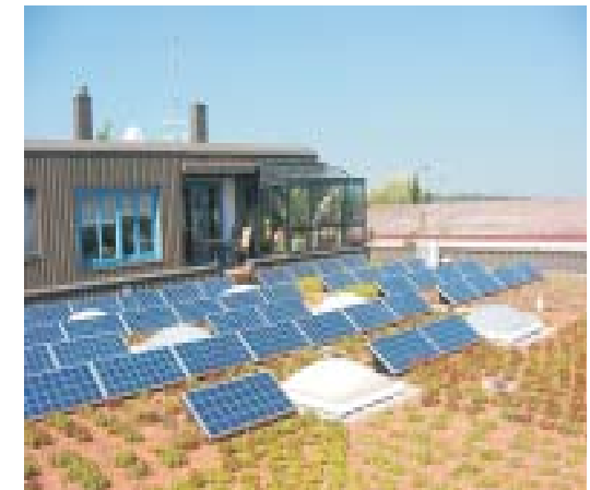
Firma Gehr in Bodelshausen