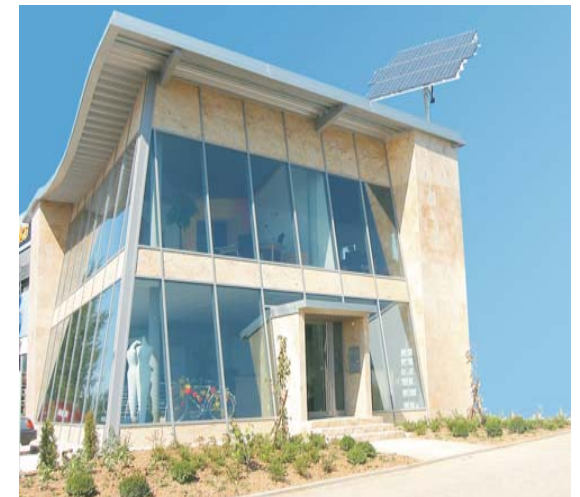
Firma Bauer in Wolfschlugen 2x 2KW Anlage mit 32 Solar-Elementen